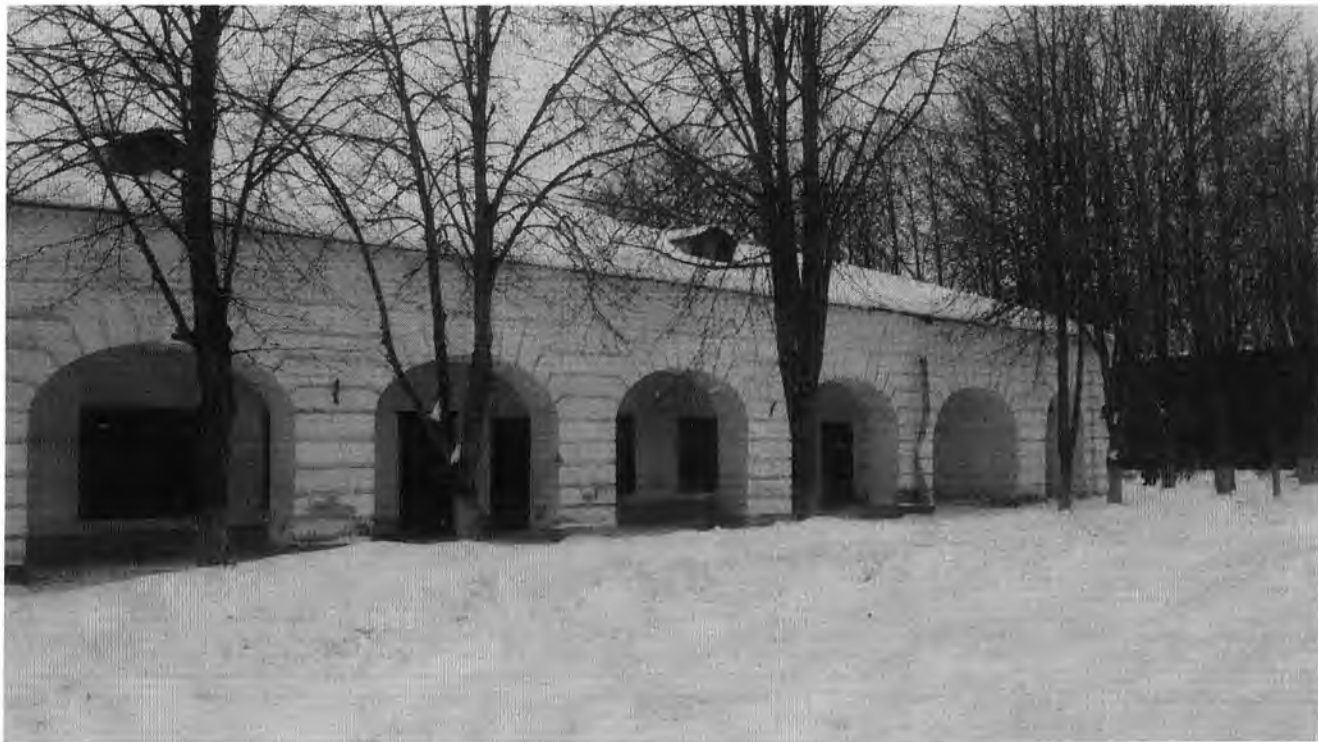
Фото 5 (январь 2017 г.)