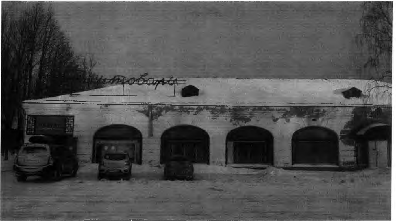
Фото 3. (январь 2017 г.)