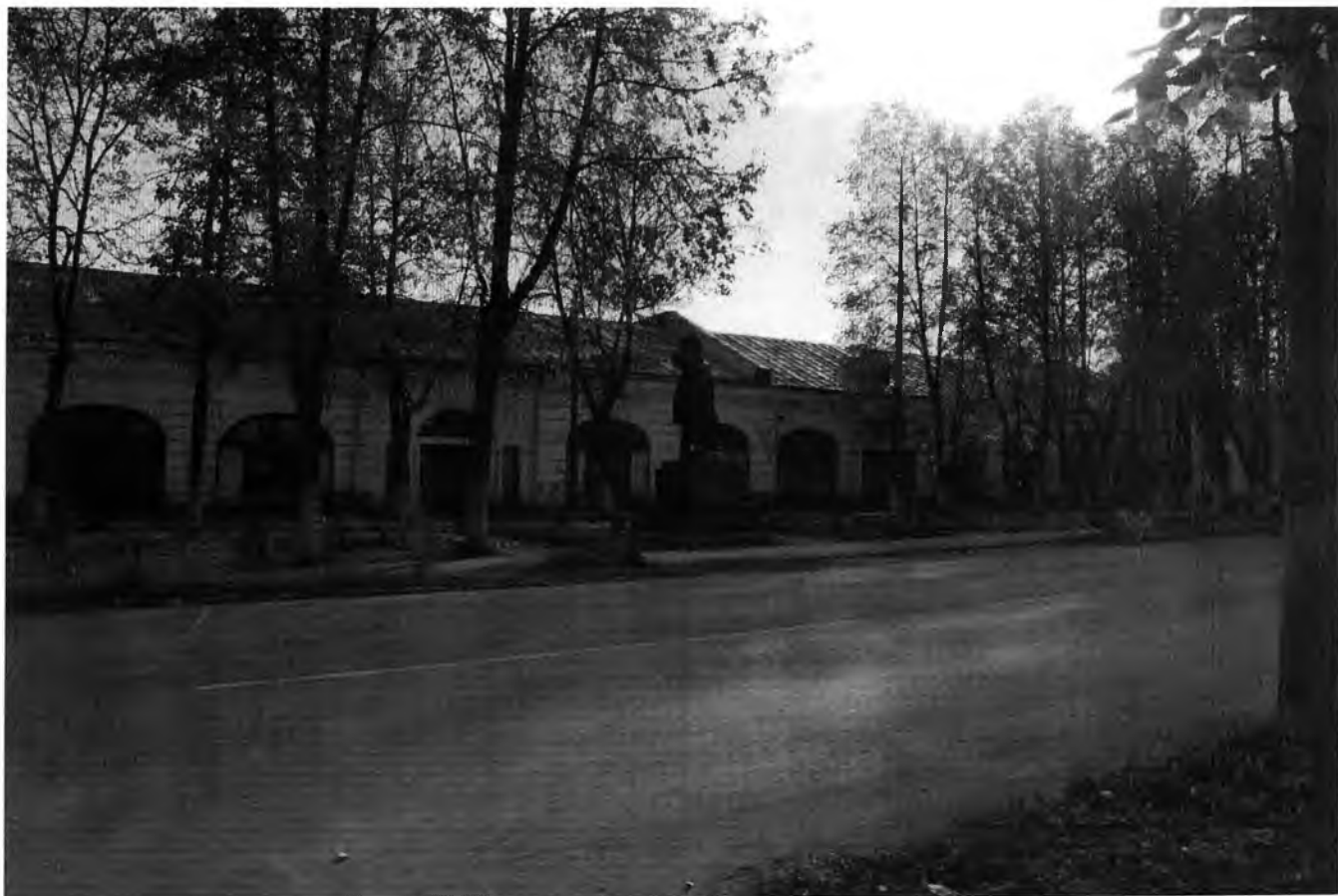
Фото 1. Общий вид, расположенный по адресу: Ленинградская область, Волховский муниципальный район, муниципальное образование Новолодожское городское поселение, г. Новая Ладога, проспект Карла Маркса, д. 29 (сентябрь 2016 г.)