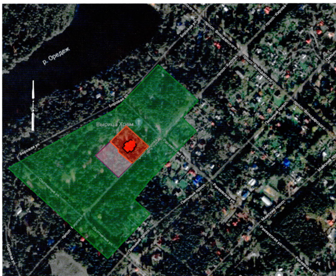
Карта (схема) границ зон охраны