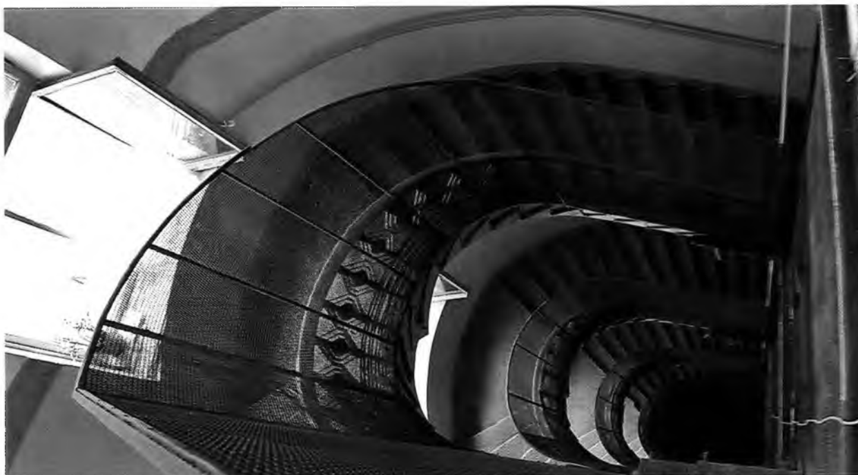
ФОТО 13. Интерьер. Декоративный орнамент стен парадной.