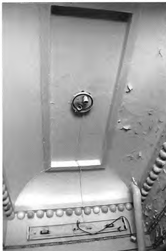
ФОТО 11. Интерьер. Ограждение лестницы.