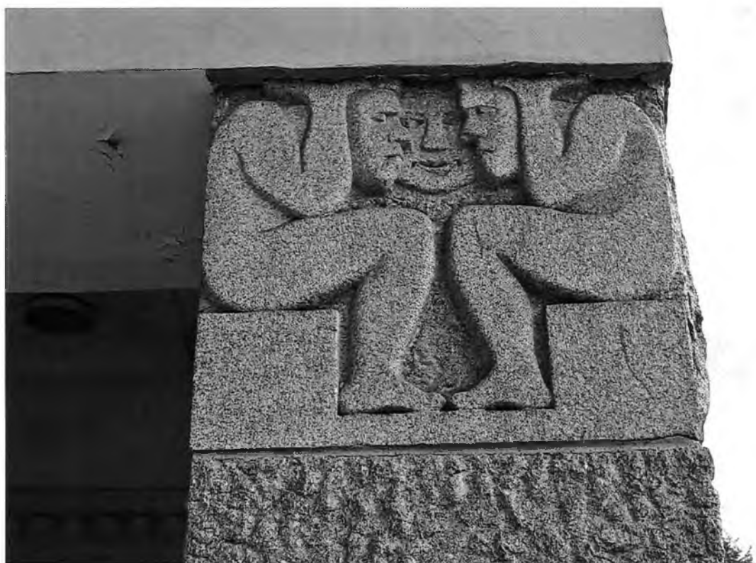
ФОТО 5. Декоративное оформление стен крыльца-ниши.