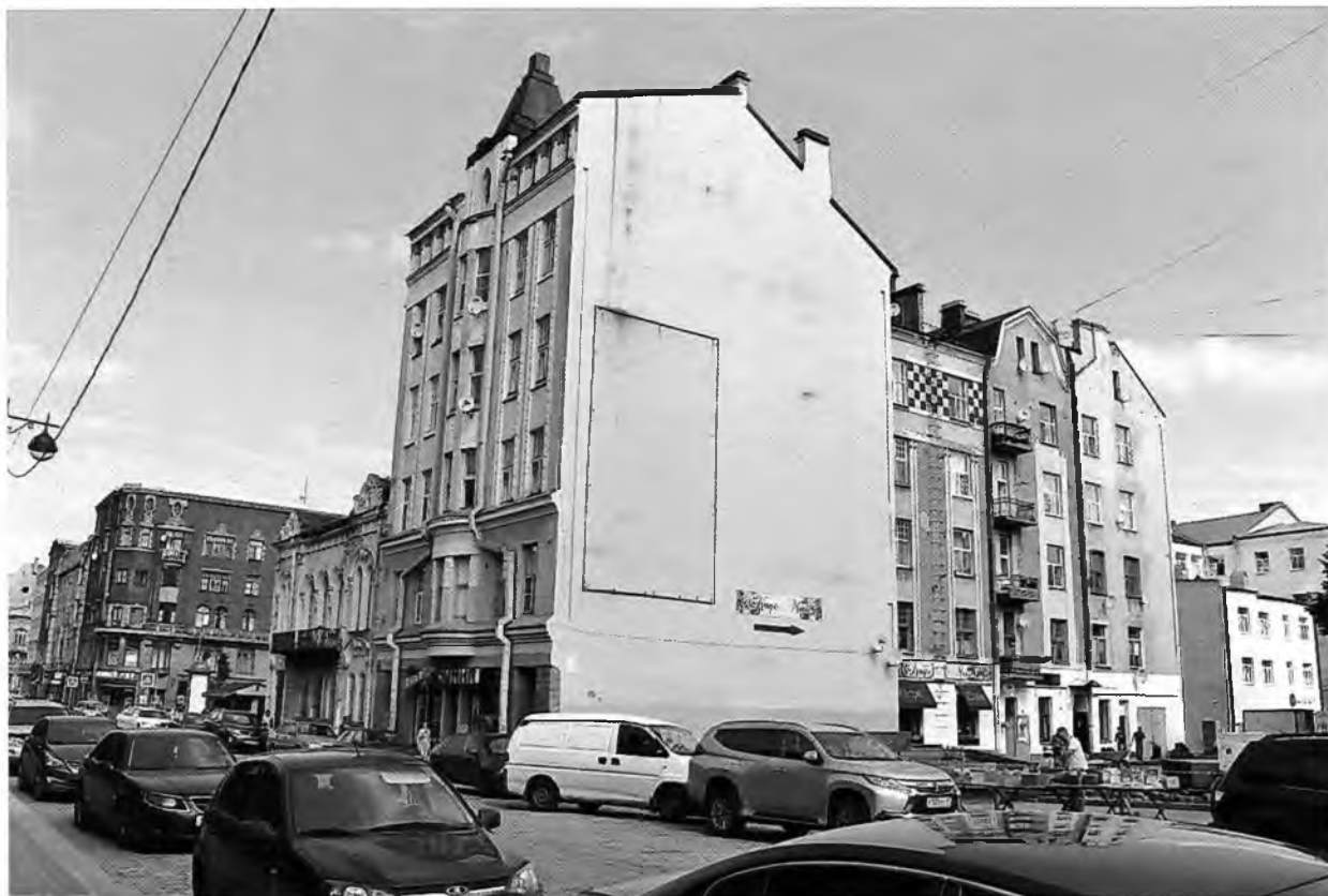
ФОТО 7. Вид здания с восточной стороны.