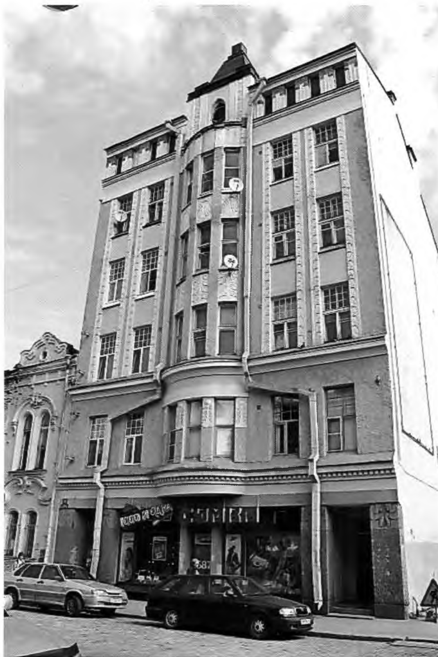
ФОТО 1. Вид здания с южной стороны. Лицевой фасад.