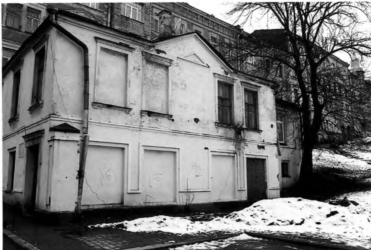
Фото 4. Вид на северо-западный фасад.