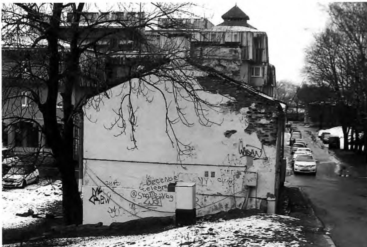
Фото 2. Юго-западный фасад.