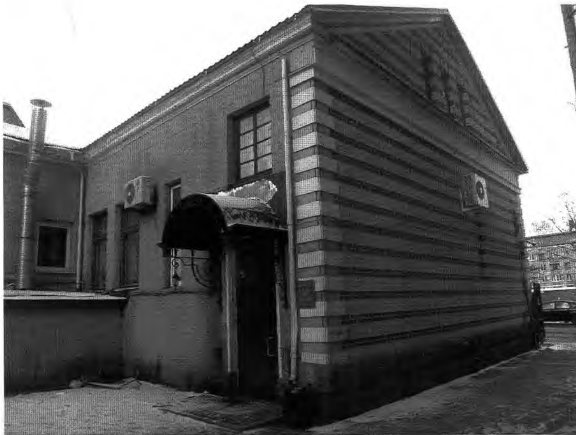
Полицейское управление: служебное здание, конюшня. Общий вид дворовой части с юго-востока.