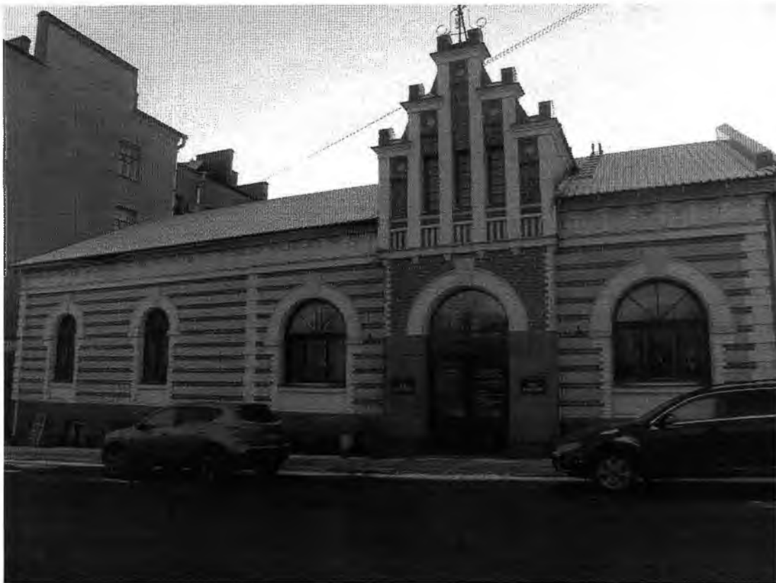
Полицейское управление: служебное здание, конюшня. Главный северный фасад. Фрагмент