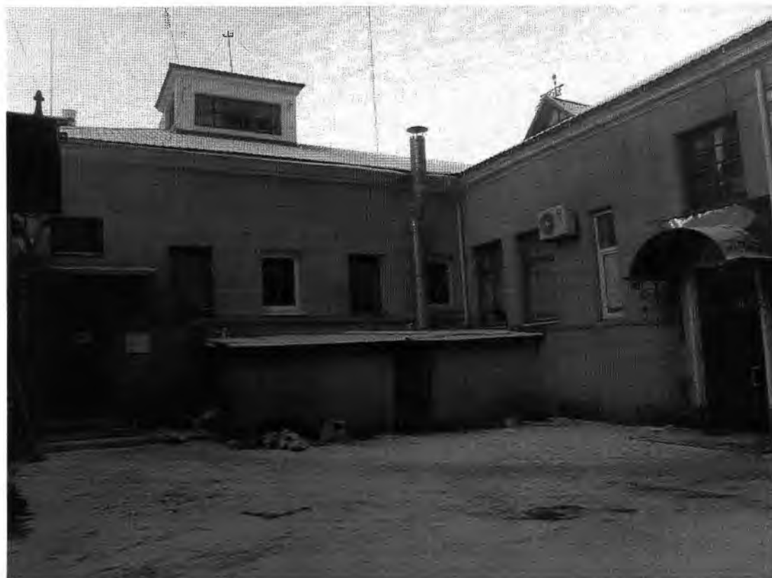
Полицейское управление: служебное здание, конюшня. Общий вид дворовой части с востока.