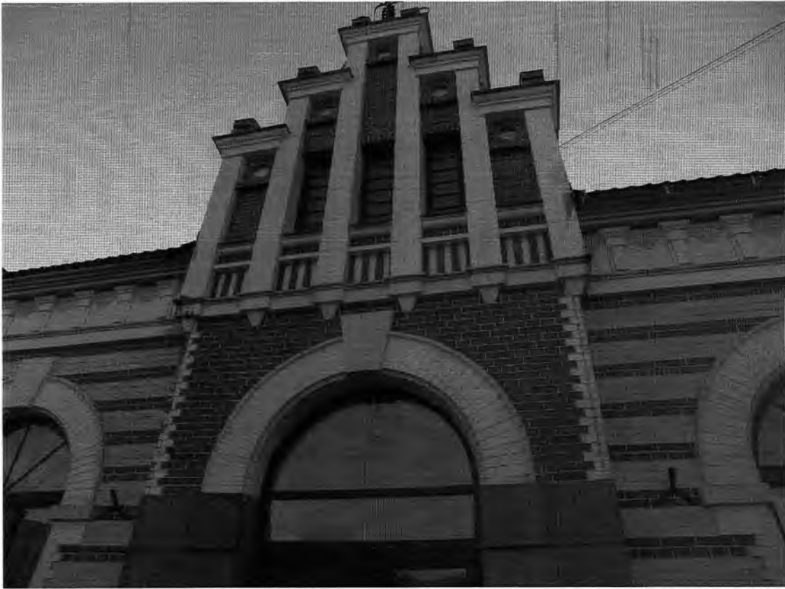
Полицейское управление: служебное здание, конюшня. Главный северный фасад. Фрагмент