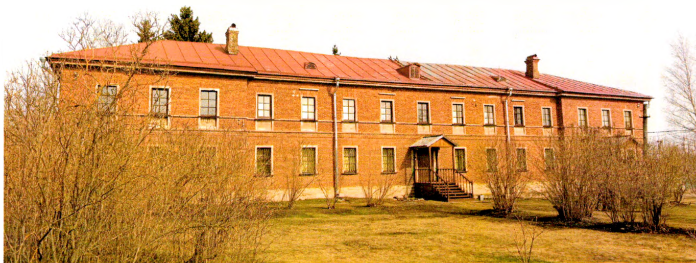
Фото 1. Общий вид на здание и прилегающую территорию с южной стороны.