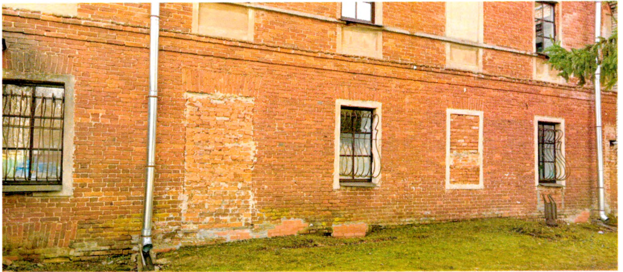
Фото 6. Фрагмент северного фасада.