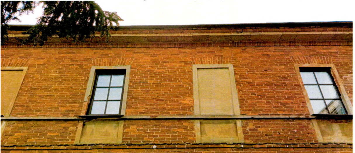
Фото 7. Фрагмент северного фасада. Характер отделки - лицевой кирпич. Оконные проемы с клинчатыми кирпичными перемычками декорированы прямоугольными штукатурными наличниками. Венчающий карниз из лекального кирпича оперт на вынесенные за плоскость фасада лещадные плиты.