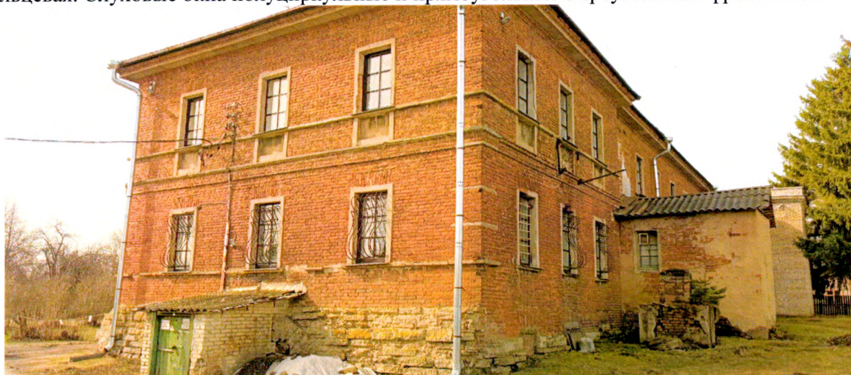
Фото 4. Вид на северо-восточный угол здания. По углам здание декорировано рустом в уровне первого этажа. Межэтажный пояс из известняковых плит, под окнами второго этажа декоративные ниши. Кирпичные пристройки северного фасада сер. XX в.