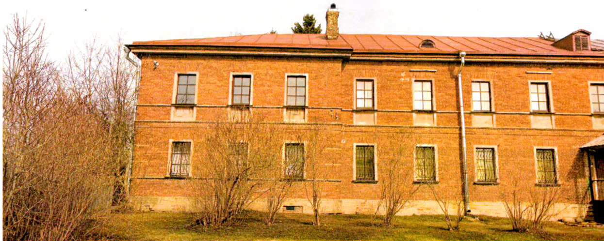
Фото 3. Фрагмент южного фасада. Отделка лицевым кирпичом. Кровля металлическая фальцевая. Слуховые окна полуциркульные и прямоугольные с треугольным фронтоном.