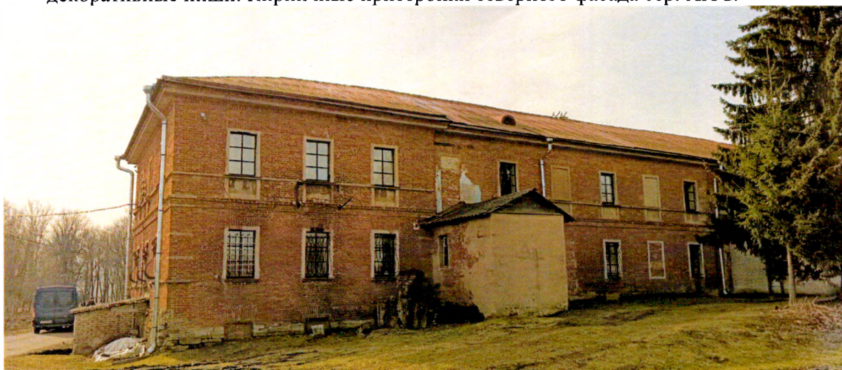
Фото 5. Вид на северный фасад. Кирпичные пристройки сер. XX в.